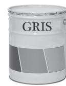
minyak atau gris