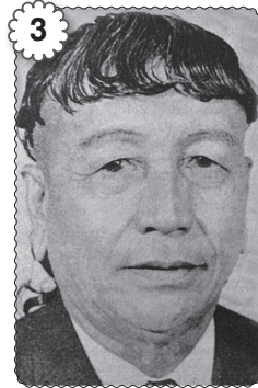
3 Tun Temenggung Jugah anak Barieng