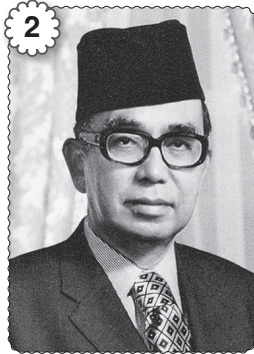
2 Tun Abdul Razak Bin Hussein