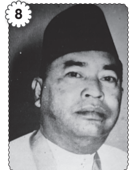
8 Datu Bandar Abang Haji Mustapha