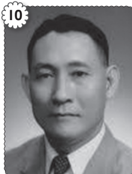
10 Tan Sri Wong Pow Nee