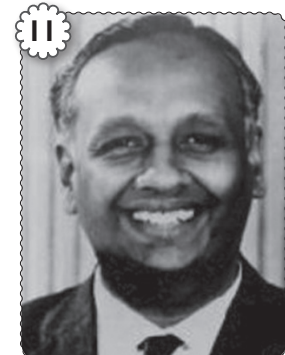
11 Tun V. T. Sambanthan