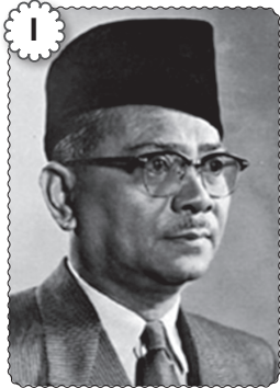
1 Tunku Abdul Rahman Putra Al-Haj