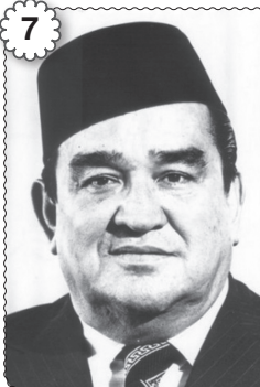
7 Tun Muhammad Fuad Stephens