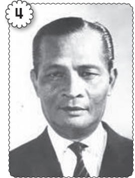
4 Tun Datu Mustapha bin Datu Harun