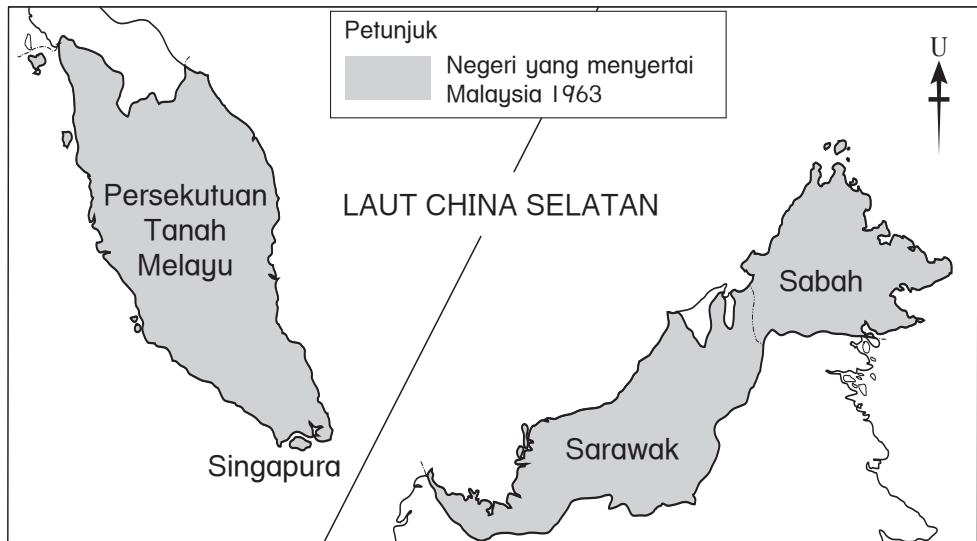
Peta negeri yang meyertai Malaysia 1963.