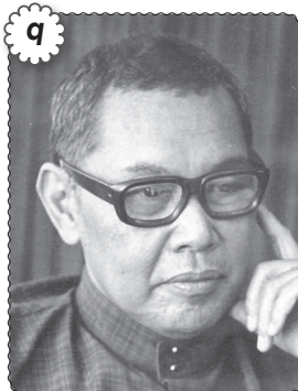
9 Tun Muhammad Ghazali Shafie