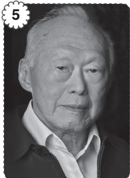
5 Lee Kuan Yew