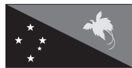
Papua New Guinea